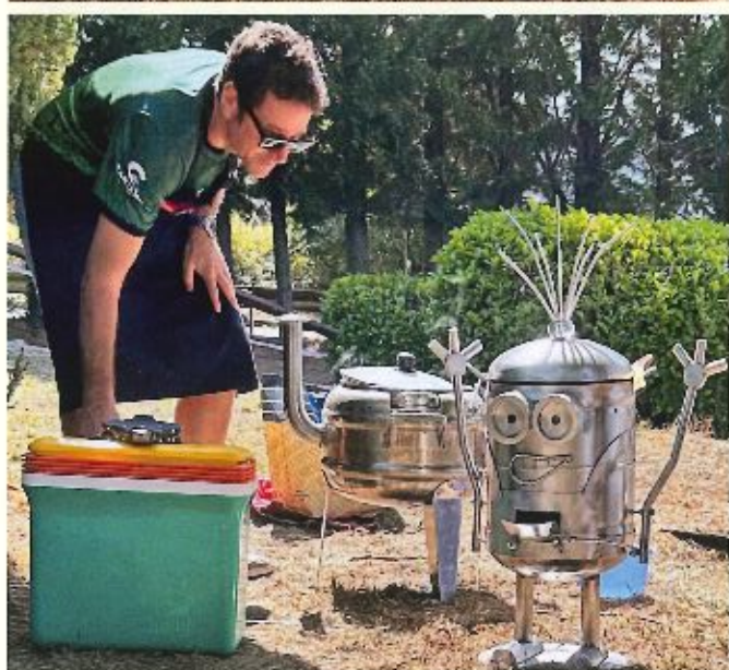
▲ Diferentes momentos del XVII Concurso de Ollas Ferroviarias.