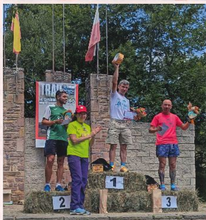
▲► Jornada del Trail en Montesclaros.